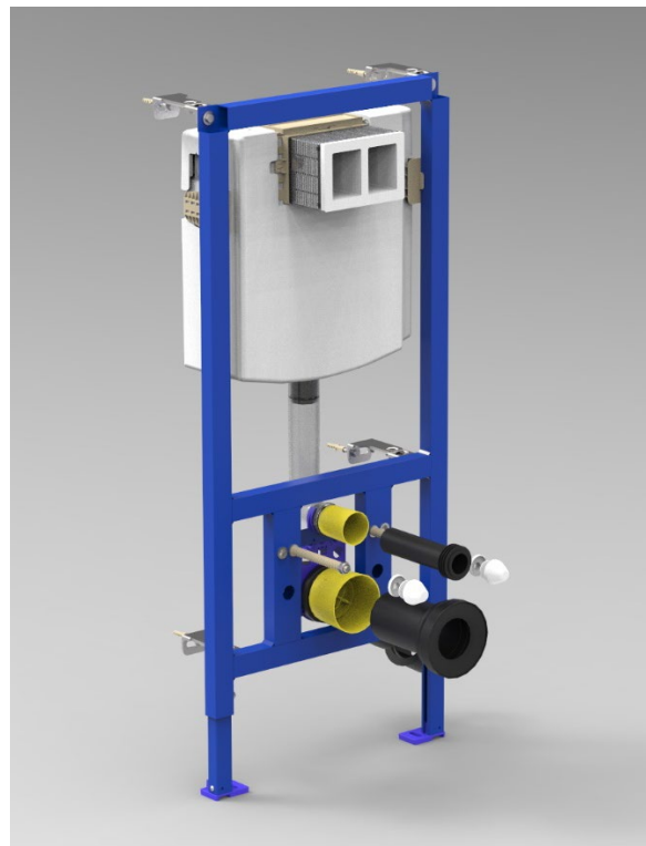
Fig. 1: Sanitärtechnik Eisenberg GmbH WC-Element Ineo SCAN innbyggingssternerne (art. nr. 90.736.00)

WC-Element Ineo SCAN innbyggingssternerne kan benyttes i badetrom og toalettrom der man ønsker skjult montering av systerne. Når innbyggingssternerne monteres som beskrevet i pkt. 6, vil systemet tilfredsstillende krav til vedlikehold og utskifting av systerne, sikkerhet mot eventuell lekkasje og synliggjøring av eventuelt lekkasjevann.