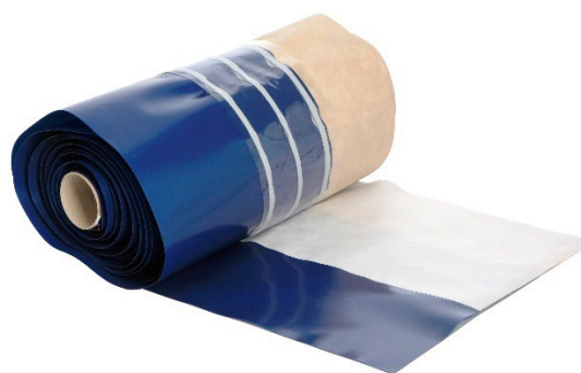
Fig. 1 Mataki Halotex Svillemembran Universal.

Mataki Halotex Svillemembran Universal kan brukes under trekonstruksjoner som er plassert på murt eller støpt grunnmur/ringmur. Svillemembranen kan monteres på ringmur i gulv på grunn hvor man ønsker å sammenføre radonflik og radonmembran.