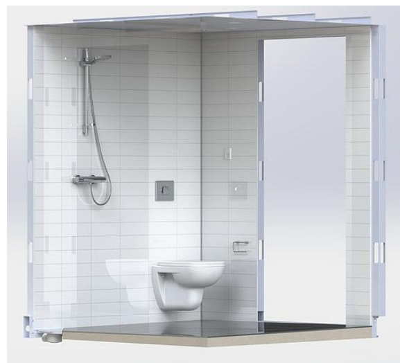
Fig. 1 Badekabine GreenBox One leveres komplett med flislagte overflater og ferdig montert sanitærutstyr

Sluket er plassert i hjørnet mot vegg i dusjsone. Sluk skal monteres i samsvar med tettesjiktets monteringsanvisning, se fig. 2.