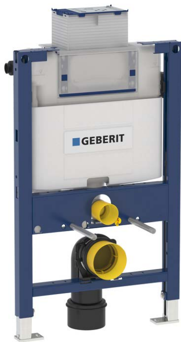
Fig. 2 Geberit Duofix Omega Figur: Geberit AS