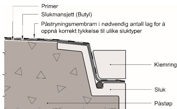
Fig. 2 Oppbygning av sluk med klemring

På sluk med limflens av stål legges primer frem til sluket før det legges Soudaseal 228 LM over limflensen på sluket. Slukmansjettten monteres deretter over sluket. Det legges så 2 strøk membran over slukmansjettten, se figur 3. Metallet som slukmansjettten skal limes til avfettes før Soudaseal 228 LM og slukmansjettten monteres.