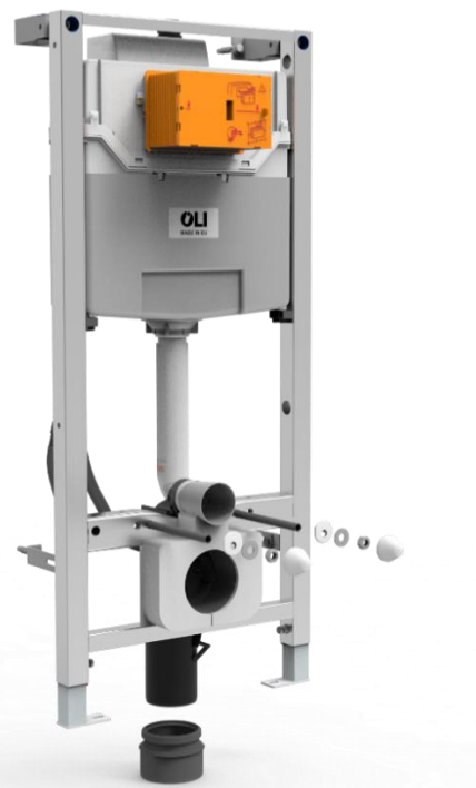
Fig. 1: Oli Sistemas Sanitarios SA OLI120 Plus N innbyggingsysterne

OLI120 Plus N innbyggingsysterne kan benyttes i badrom og toalettrom der man ønsker skjult montering av systerne. Når innbyggingsysterne monteres som beskrevet i pkt. 6, vil systemet tilfredsstillende krav til vedlikehold og utskifting av systerne, sikkerhet mot eventuell lekkasje og synliggjøring av eventuelt lekkasjevann.