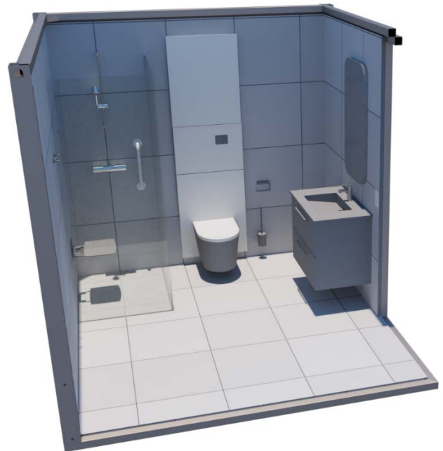
Fig. 1 Boxen prefabrikkerte badersmoduler leveres komplett med flislagte overflater og ferdig montert sanitærutstyr.

Golvet i dusjonen har et fall på minimum 1:50. Golvet på utsiden av dusjonen har et fall på minimum 1:100. Badersmodulene utformes slik at høydeforskjellen mellom toppen av slukristen og membran ved terskel er minst 25 mm. Modulene kan leveres med slukrenne, hjørnesluk eller rundt sluk