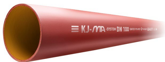
Fig. 1 KJ-MA Avløpssystem – MA-rør

Godkjenningen gjelder for bortledning av avløpsvann (gråvann) inne i bygninger. Systemet kan også benyttes til bortledning av innvendig overvann, men slike installasjoner er ikke omfattet av denne godkjenningen.