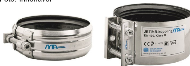
Fig. 3 KJ-MA Avløpssystem – Koblinger