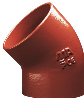
Fig. 2 KJ-MA Avløpssystem – Bend 45°