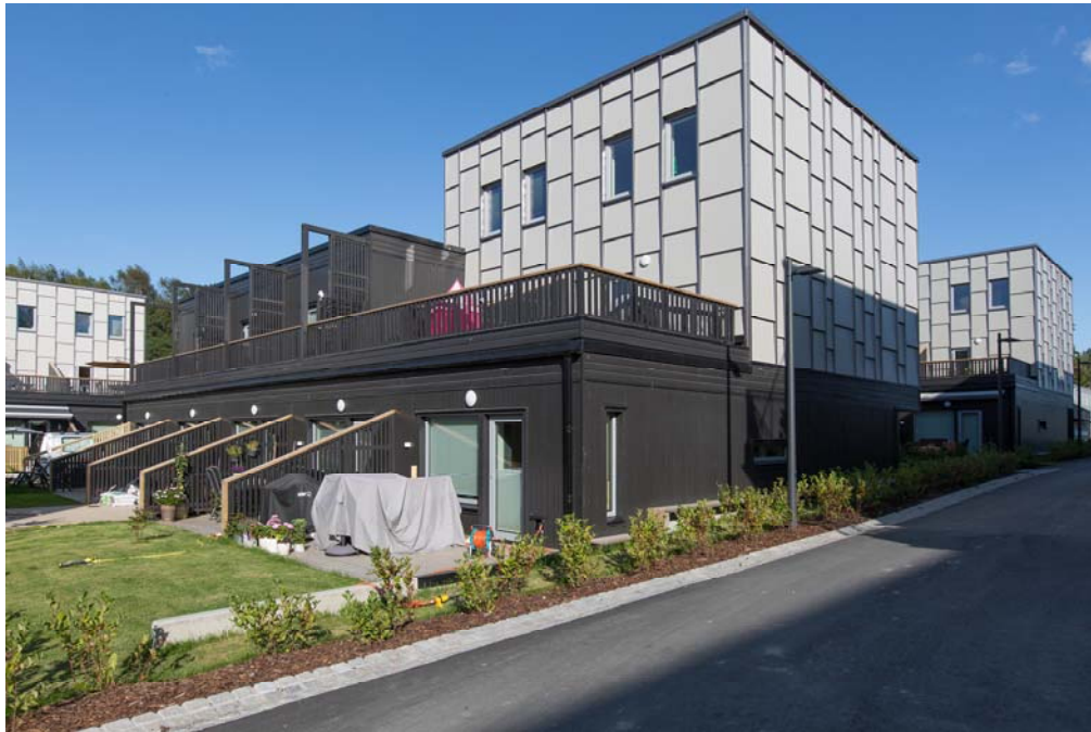
Lørenskog Stasjonsby, Sprinten