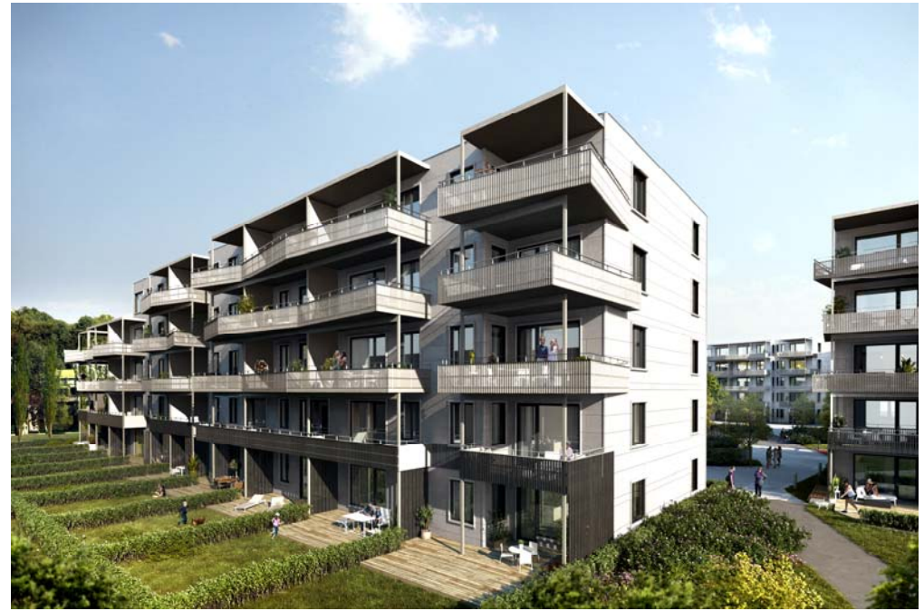
Lade Alle, Trondheim