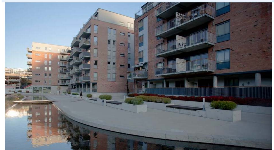
Også i Norge øker bruken av prefabrikerte elementer. Disse fire blokkene blir ført opp med prefabrikerte betongelementer i stedet for stål som bærende konstruksjon.